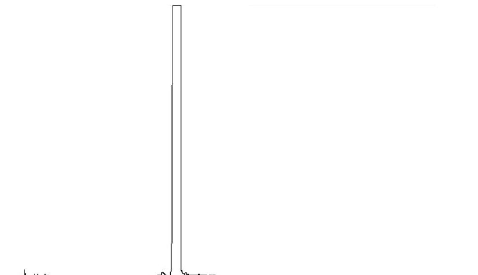
图 B.1 食品添加剂苯甲酸苄酯气相色谱图